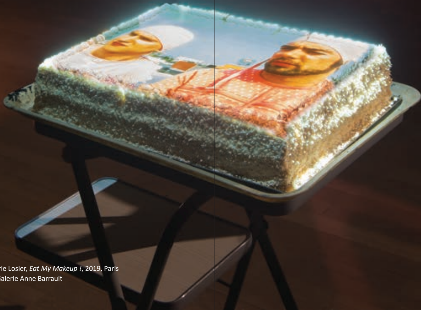
Marie Losier, Eat My Makeup I , 2019, Paris