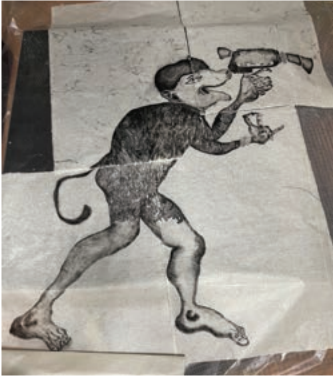
Marie Losier, Merry Go round , គំនូរប្រេងនៅលើក្រដាសអង្ករ ឆ្នាំ២០២៤ © Institut français du Cambodge