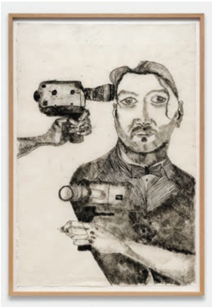
Marie Losier, David Legrand , ឆ្នាំ ២០១៩ គំនូរប្រេងនៅលើ ក្រដាសអង្ករ, ៩៨ x ៦១ សង់ទីម៉ែត្រ / ១០៤ x ៧២ សង់ទីម៉ែត្រ (ជាមួយស៊ុម) © រូបថត Aurélien Mole. វិចិត្រសាល Anne Barrault