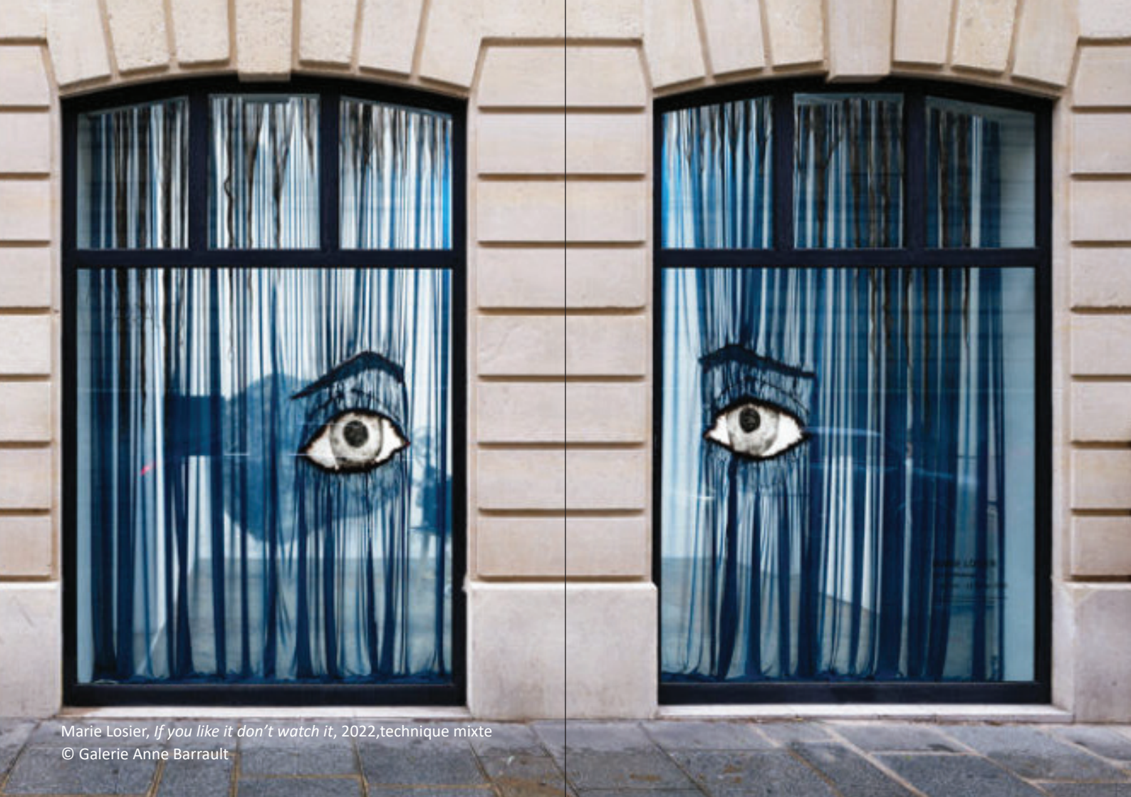
Marie Losier, If you like it don't watch it , 2022, technique mixte