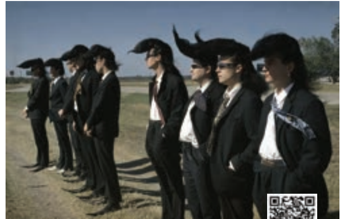
ថ្ងៃទី ១០/០២/២០២៤ - ម៉ោង២:០០រសៀល

ក្រុម Rock'n Roll របស់រុស្ស៊ី Leningrad Cowboys ក្នុង ដំណាក់កាលគ្មានជោគជ័យ និងគ្មានអនាគតក្នុងពិភពតន្ត្រី សម្រេចចិត្តចាកចេញពីតំបន់ស៊ីបេរីទៅអាមេរិកក្នុងក្តីសង្ឃឹមស្វែងរក ភាពល្បីល្បាញ។ ក្នុងអំឡុងពេលធ្វើដំណើរទៅកាន់គោលដៅនេះ ក្រុមនេះបានឆ្លងកាត់ទ្វីបអាមេរិក ដែលនៅទីនោះពួកគេរួមបញ្ចូល គ្នានូវរក្សាចំតន្ត្រីរបស់ពួកគេ ជាមួយនឹងការស្វែងយល់សិល្បៈរបស់ ពួកគេ។