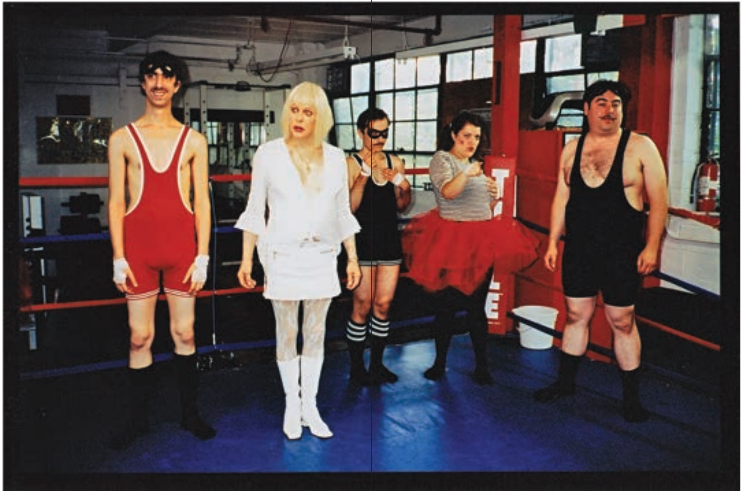
Marie Losier, Papal BrokenDance , 2008, 16mm