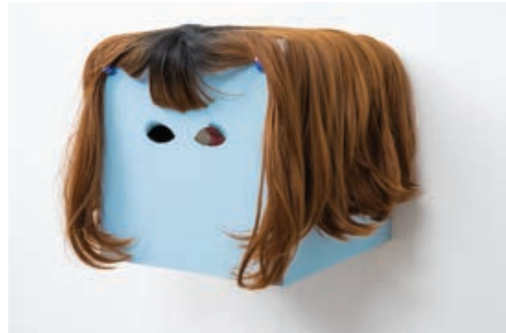
Marie Losier, Flying Saucy! (ឆ្នាំងហោះ), ២០២១, វីដេអូ (ឆ្នាំ២០០៦), សក់ពាក់និងអាគ្រីលីកនៅលើឈើ