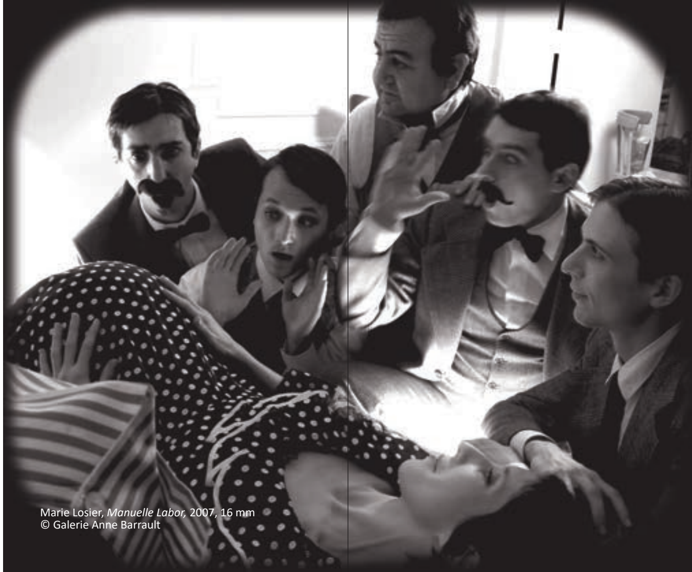
Marie Losier, Manuelle Labor , 2007, 16 mm