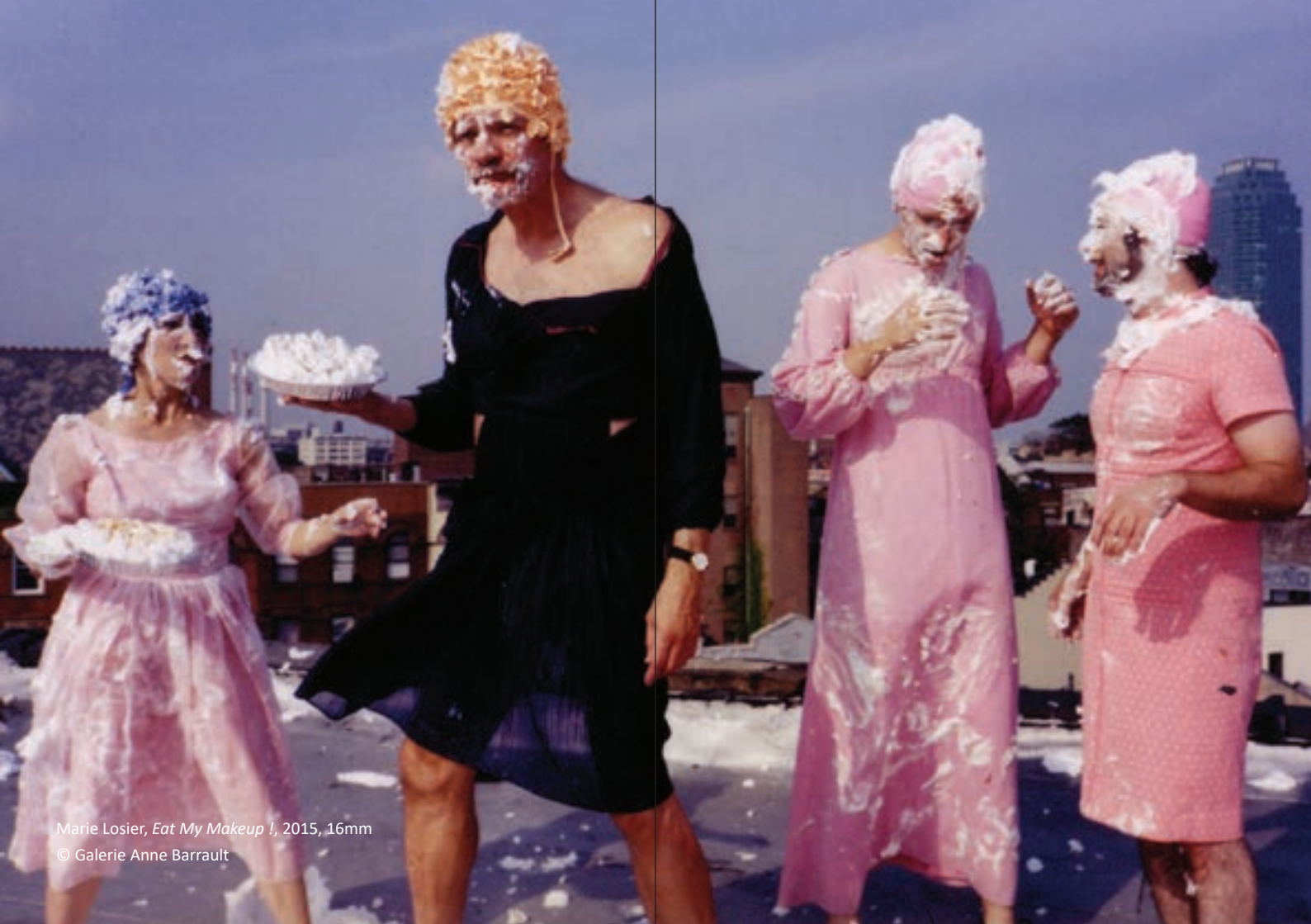
Marie Losier, Eat My Makeup I , 2015, 16mm