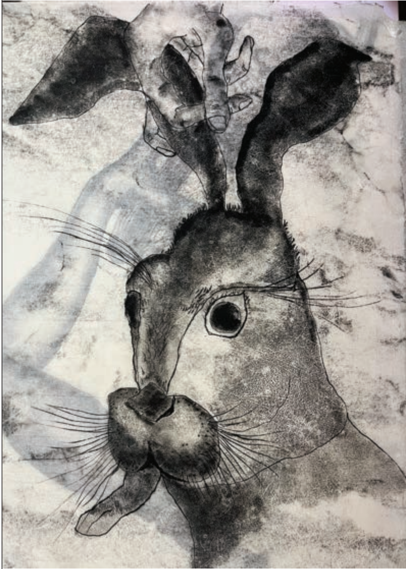
Marie Losier, Merry Go round , គំនូរប្រេងនៅលើក្រដាសអង្ករ ឆ្នាំ ២០២៤ © Institut français du Cambodge

ផ្ទាំងគំនូរនេះគួរលើក្រដាសអង្ករជាមួយថ្នាំលាបប្រេង ប្រើបច្ចេកទេស monotype ។ ខ្ពស់ និងទូលំទូលាយ ផ្ទាំងគំនូរនេះគឺជាសក្ខីកម្មសិល្បៈមួយនៃការជ្រមុជចូលក្នុងជីវិតប្រចាំថ្ងៃរបស់លោកស្រី Marie Losier នៅប្រទេសកម្ពុជា។ វាតំណាងឱ្យចំនួនមនុស្សសត្វមានជីវិតជាច្រើន ដែលភាគច្រើនជាសត្វ។ ទាំងនេះត្រូវបានដកស្រង់គំនិតមកពីអ្វីដែលលោកស្រីបានសង្កេតឃើញ ទទួលអារម្មណ៍ យល់ឃើញ និងលេបចូលក្នុងទីក្រុងភ្នំពេញជារៀងរាល់ថ្ងៃ។ សិល្បៈខ្មែររួមផ្សំឡើងដោយតំណាងនៃសត្វពាហនៈនៅក្នុងចម្លាក់នានា រឿងព្រេង ទេវៈទេពធីតា ព្រះនាង ឬសូម្បីតែសត្វបែបកាត់ ពាក់កណ្តាលមនុស្ស ពាក់កណ្តាលស្រ្តី ពាក់កណ្តាលសត្វ មករស់និងមានចលនាក្រោមកណ្តាប់ដៃសិល្បការិនីផ្នែកសិល្បៈប្លាស្ទិចរូបនេះ។