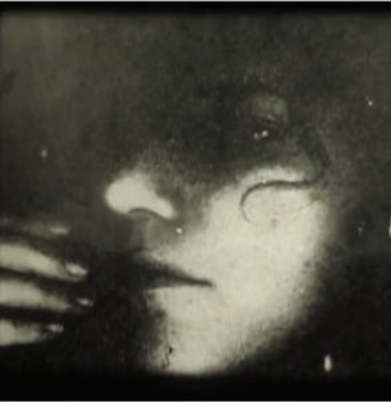
Marie Losier, Lunch Break on the xerox machine , 2003, 16mm, 3 min