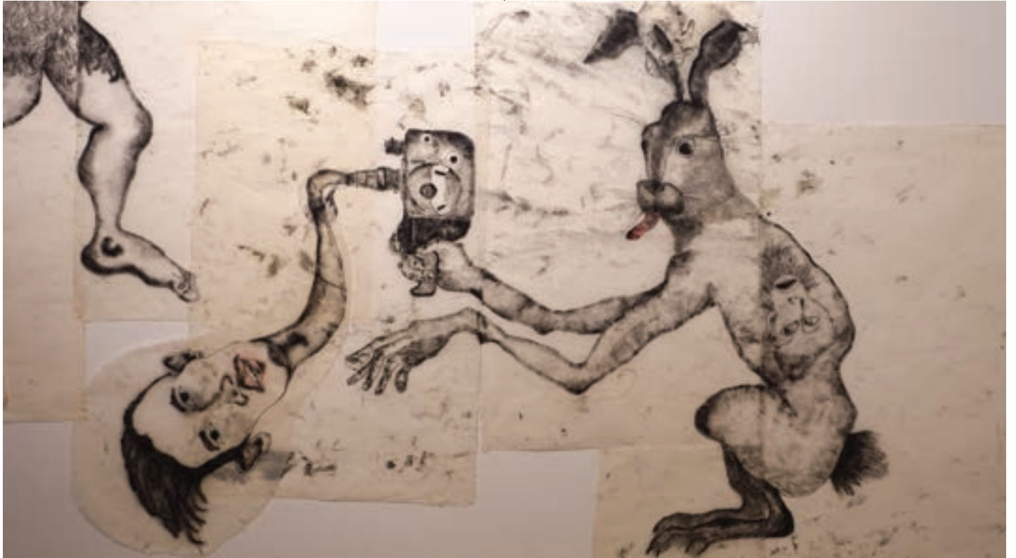
Marie Losier, Merry Go round , គំនូរប្រេងនៅលើក្រដាសអង្ករ, ឆ្នាំ ២០២៤