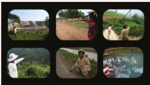
Paysage No 1, Nguyen Trinh Thi, 2013