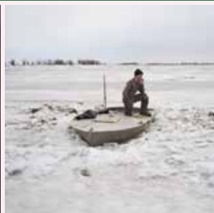
Claudine Doury / Agence VU